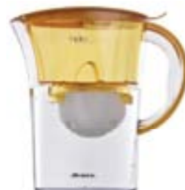
ARIETE Hidrogenia 140