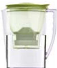
COOP VIVI VERDE

Rilascio di argento. Serve a contrastare la proliferazione batterica. La nostra acqua di partenza non conteneva argento e non la abbiamo arricchita come è avvenuto per gli altri parametri. Di solito, infatti, questo metallo non è presente nell'acqua dell'acquedotto. Le cartucce del test ne rilasciano tutte: le due Brita ne perdono meno di tutti, mentre Ariete ne rilascia un bel po', soprattutto a inizio vita della cartuccia. Per l'argento non c'è un limite di legge, esiste però una linea-guida dell'Organizzazione mondiale della sanità, che suggerisce che quando i sali di argento sono utilizzati per mantenere la qualità batteriologi-