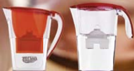
IMETEC WP 130

IN LABORATORIO Per verificare l'efficacia dei filtri nel migliorare l'acqua potabile vi abbiamo aggiunto alcuni inquinanti (come metalli pesanti e solventi), mantenendone però la concentrazione sempre al di sotto dei limiti previsti dalla normativa sull'acqua potabile.