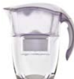
BRITA Elemaris Costo annuale: 122 euro