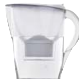
BRITA Marella Costo annuale: 115 euro