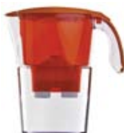
LAICA Stream 3000 SERIES Costo annuale: 91 euro

La Laica Stream ha avuto risultati accettabili; non addolcisce troppo, rilascia un po' più di argento. Le due Brita non brillano per qualità globale, perché addolciscono eccessivamente l'acqua, rilasciano ammonio all'inizio dell'uso e non brillano per microbiologia: tuttavia non hanno problemi tali da renderne sconsigliabile l'acquisto.