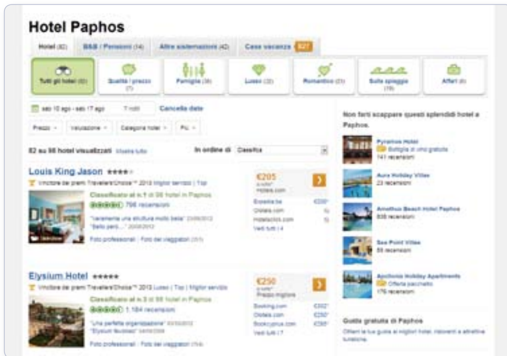
I risultati della ricerca di un servizio vengono mostrati per località e sono ordinati secondo ai giudizi espressi dagli utenti. È possibile filtrare la ricerca utilizzando diversi criteri. Sulla destra dalla schermata, inoltre, vengono elencate alcune proposte e offerte selezionate automaticamente dal motore di ricerca.

Bisogna infatti tenere presente che per lasciare un commento su Tripadvisor è sufficiente crearsi sul momento un account (è richiesto solamente un indirizzo di posta elettronica); in alternativa ognuno può dire la propria opinione utilizzando Facebook. Da ciò ne consegue che i commenti devono comunque essere sempre presi con le pinze. ✱