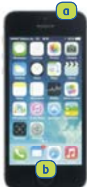
APPLE iPhone 5s (iOS)

Premete e rilasciate simultaneamente il tasto STANDBY/RIATTIVA a + quello HOME b . La schermata viene aggiunta a RULLINO FOTO.