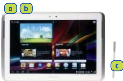
SAMSUNG Galaxy Note 10.1 (Android)

Premete e rilasciate simultaneamente il tasto di accensione a e il volume verso il basso b . Con la S Pen, tenete premuto il tasto della S Pen c , facendo pressione con la puntina sul display. Lo screenshot viene salvato nella GALLERIA all'interno dell'album SCREENSHOTS.