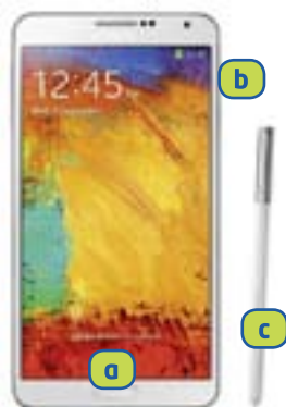
SAMSUNG Galaxy Note 3 (Android)

Premete e rilasciate simultaneamente il tasto Home a + quello di accensione b . Con la S Pen, tenete premuto il tasto della S Pen c , facendo pressione con la puntina sul display. Lo screenshot viene salvato nella GALLERIA all'interno dell'album SCREENSHOTS.