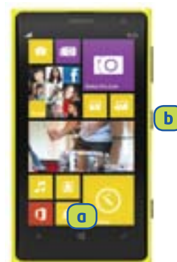
NOKIA Lumia 1020 (Windows Phone)

Premete e rilasciate simultaneamente il tasto Home (quello con il logo Windows) a + quello di accensione e spegnimento/tasto di blocco b . Lo screenshot viene salvato nelle FOTO, all'interno dell'album SCHERMATE.