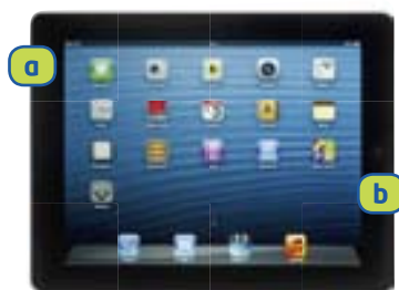
APPLE iPad Air (iOS)

Premete e rilasciate simultaneamente il tasto di accensione a e il volume verso il basso b . Con la S Pen, tenete premuto il tasto della S Pen c , facendo pressione con la puntina sul display. Lo screenshot viene salvato nella GALLERIA all'interno dell'album SCREENSHOTS.